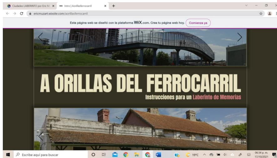
Fig. 1 A orillas del Ferrocarril . Eric Muzart 2021

La novedad de proyecto radica en que se trata de una traducción de la cartografía tradicional a un formato digital y una experiencia interactiva. Para este propósito se consideró como 3) Género discursivo particular en el diseño de un recorrido laberíntico: el palimpsesto o formato multicapas. Los nuevos géneros discursivos que surgen en la web a modo de Jardín de senderos que se bifurcan en hipervínculos y capas que permitirán el diseño de un laberinto con tres niveles. En ese sentido se va a generar un texto híbrido (Burke) y un palimpsesto (Genette) por su composición en varias capas de escritura y por la combinación de otros géneros literarios preexistentes. Es decir, se trata un híbrido entre la cartografía, la poesía laberinto o anagramática, y écfrasis en un proceso de traducción del texto en formato trasmedia y utopía como modelo ideal de ciudad.