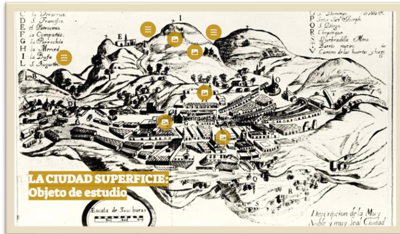
Fig. 2. Capas 0 y 1, genial.ly. Eric Muzart 2021

La segunda capa corresponde al nivel subterráneo e incluye imágenes superpuestas para indicar objetos de estudio múltiples y entramados. El fondo es la geografía subterránea de Kircher, con narraciones interpoladas de Caramuel y de Borges. La capa final corresponde al mapa de estrellas o constelaciones donde los objetos de interés son: el caleidoscopio, el Atlas y la cinta de Moebius como técnica que permite vincularse con “lo que subyace”. Narración interpolada es el video de Lygia Clark y el concepto de mestizaje que guía la práctica investigativa, entendida como actividad social-individual compuesta por actividades propias del pensamiento artístico, donde se proyecta integrar: personas productoras de artes, gestores culturales (Historias de vida), monumentos no institucionalizados (apropiaciones del espacio público) y memorias no oficiales.