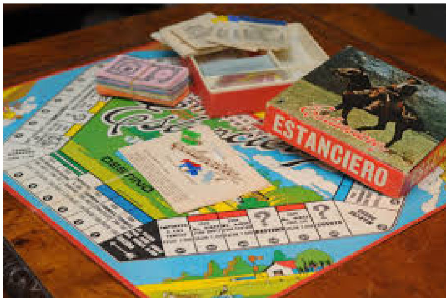
Imagen del Juego: ii

Premios e Impuestos: existen casilleros que indican al jugador que debe pagar o cobrar determinada cantidad de dinero. Estas transacciones se realizan entre el banco y el jugador.