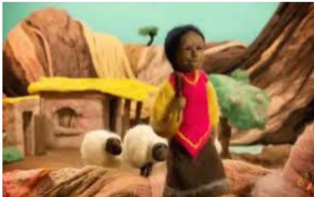
Figura n° 1

del constructo pone en evidencia el dispositivo, pero, al mismo tiempo, el m a t e r i a l sostiene el a r t i f i c i o habilitando la exploración