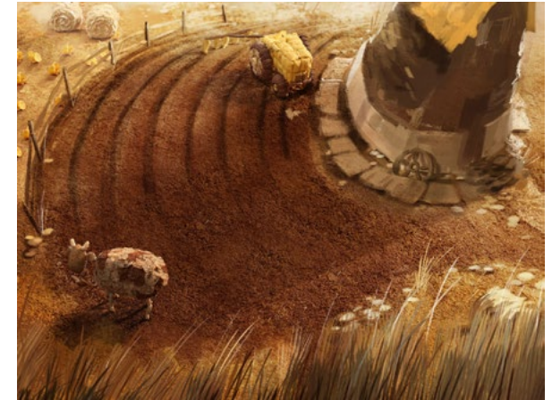
Figura n° 3

el perro, entre otros), fueron elaboradas con distintos tipos de cereales que caracterizan a la marca: hojuelas de maíz de los Corn Flakes , granos de arroz inflado de Choco Krispis y trigo. Una fragilidad vinculada al acto