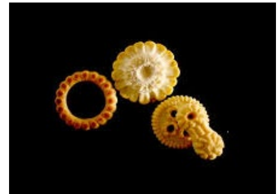
Figura n° 4

Elementos / Creación (2011) es una animación por encargo 4 en la que se alude a la relación entre la naturaleza y las tecnologías proponiendo un modo narrativo que utiliza elementos de comida (semillas, golosinas, anclado en la comida. Esta pieza es parte de una serie de cinco spots; en este caso se recorre la historia de los inventos del hombre utilizando objetos alimentarios como forma expresiva (Figura N°4). Galletas, nueces, semillas, frutas, verduras, se