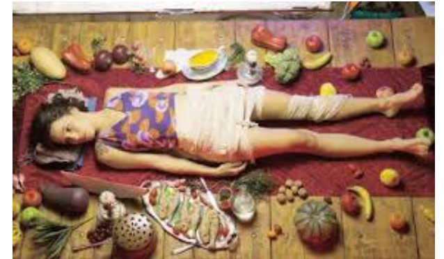
Figura n° 2

objeto, lo humano se transforma en una suerte de “marioneta” (Figura N°2). Este ejercicio, de enorme exigencia para el actor/la actriz por el tiempo y esfuerzo físico que requiere la duración del registro de las tomas, permite