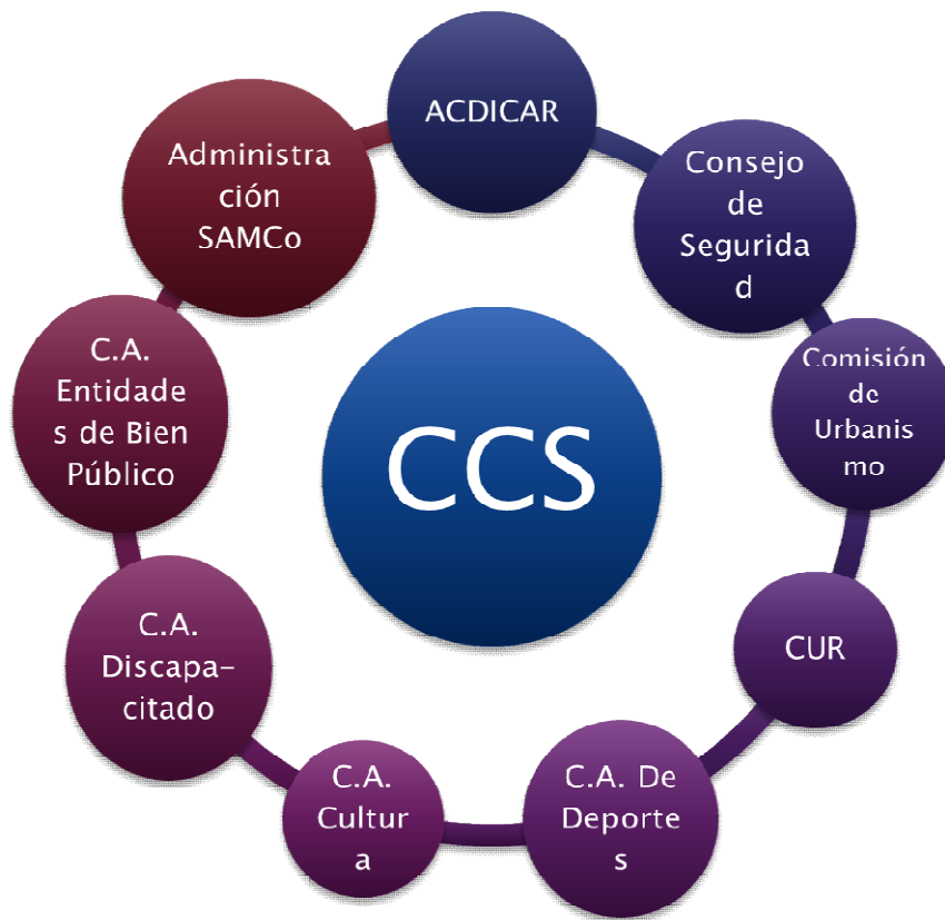
Figura 2: Esquema co construido entre Investigadores de Instituto Praxis y Secretaría de gobierno y Subsecretaría de Gestión y Participación de la Municipalidad de Rafaela. Año 2014.

Desde ese entonces, con el acompañamiento de investigadores del Instituto de Investigaciones Tecnológicas y Sociales para el Desarrollo Territorial “Praxis” 26 , se viene revisando, repensando, y profundizando el rol del Consejo Consultivo Social, hoy constituido como un espacio de diálogo interinstitucional valorado en la ciudad de Rafaela.